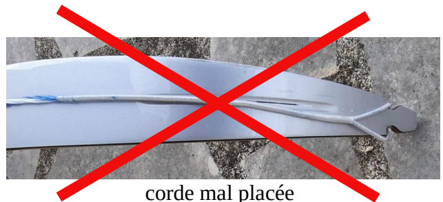
corde mal placée