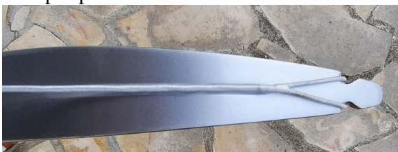
corde bien placée

10 – vérifier que la corde est correctement placée dans les poupées